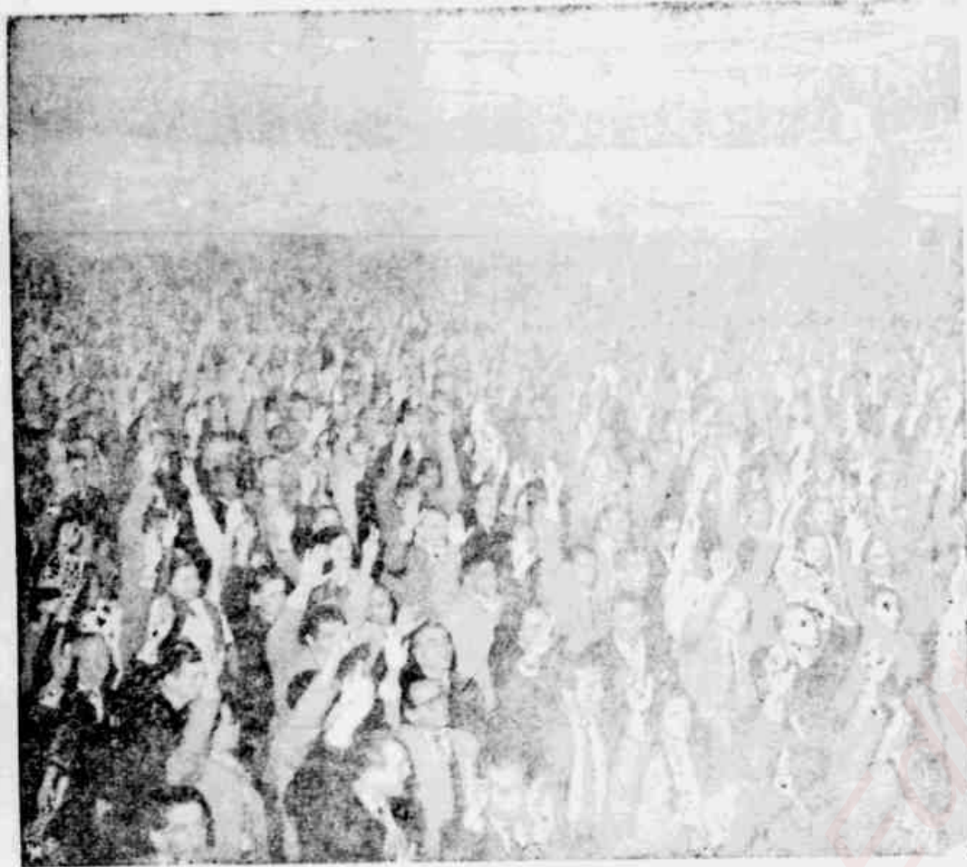
O conclave nacional do Movimento Nacional Popular Trabalhista, realizado nos dias 6 e 7 de setembro em São Paulo, que apoiou a Chapa Juscelino-Jango para a pleiteia de 1 de outubro, é o mais poderoso movimento unitário político dos trabalhadores e do povo. Já registrado na história do Brasil. No clichê um flagrante dos delegados de todo o Brasil quando aclamavam os candidatos das forças democráticas à presidência e vice-presidência da República.

A denúncia de «Folha Capixaba» sobre o plano do governo Lacerda Aguiar, visando aumentar em 10 por cento os impostos, deitar 1.500 funcionários internos do Estado, hipotecar bens do governo e a propósito de combater a situação de crise, virou assunto de primeira mão em todo o Estado. «E viva a repulsa do comércio, da indústria e do próprio povo a esse plano.»