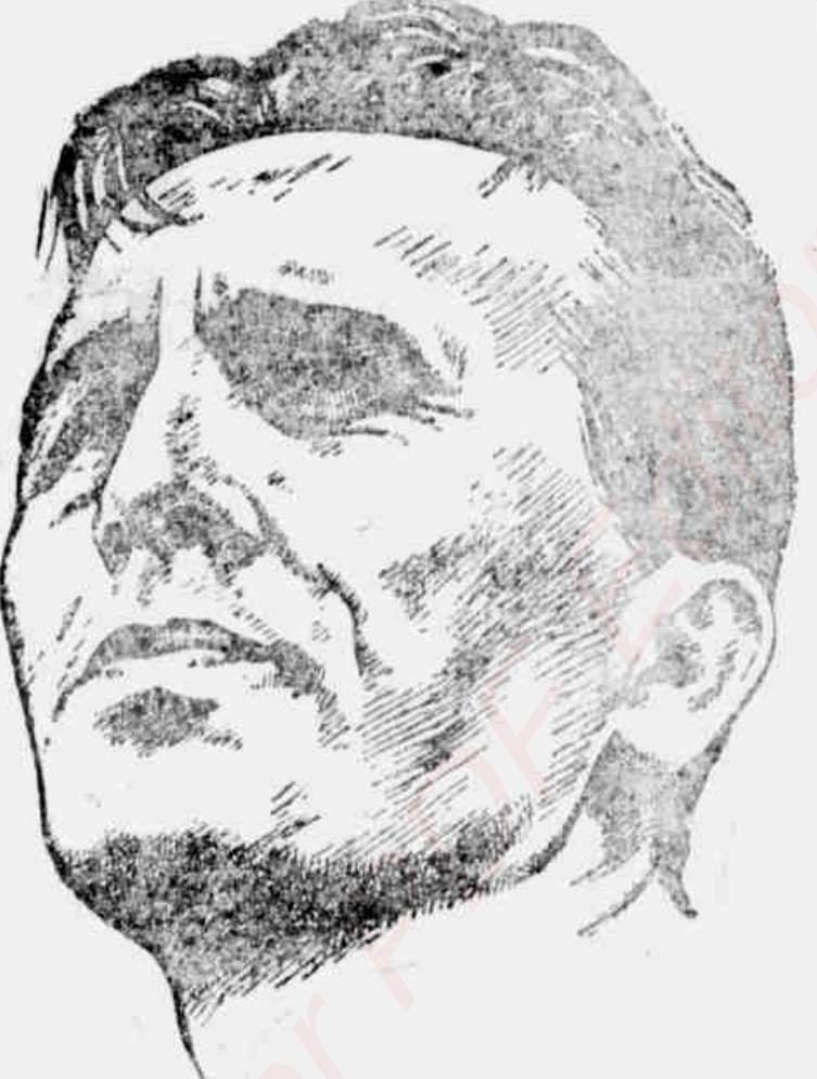
LUIZ CARLOS PRESTES

O Partido Comunista do Brasil apóia e indica aos sufrágios do povo as candidaturas à presidência e vice-presidência da República dos srs. Juscelino Kubitschek e João Goulart, os quais