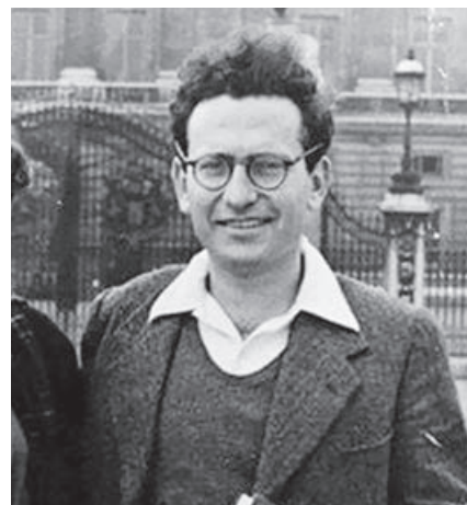
Socialist Workers Party

Estas opiniones no eran unánimes en el movimiento trotskista. Los trotskistas sudafricanos criticaron fuerte-