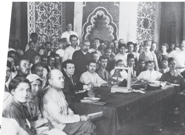
Harvard College Library

—fragmento de la declaración del Buró Central de las Secciones Judías, Partido Comunista de Rusia, Bakú (1920)