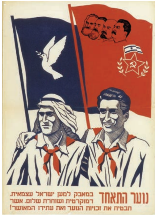
Cartel comunista israelí, 1950, impulsa la cooperación judeo-árabe y la paz...en las tierras robadas a los palestinos.

políticos, cívicos y culturales de la mayoría árabe. La segunda fase se inició a partir del 15 de mayo, cuando el nuevo Ejército israelí derrotó a los Ejércitos árabes que se habían unido al conflicto. Al decidir —de forma tardía— intervenir militarmente, los Gobiernos árabes actuaron bajo una intensa presión de su opinión pública, que se sentía profundamente angustiada por la caída una tras otra de las ciudades y aldeas palestinas y la llegada de oleadas de refugiados desposeídos a las capitales vecinas”.