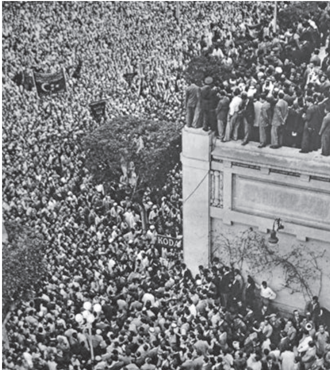
World History Archive